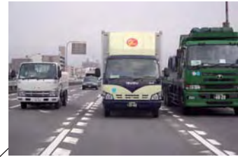
法定速度以下で走行