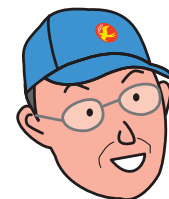
鎌田さんのコメント

燃費を軽減するために、何か自分でできることはないかと思い、本を読んだ。するとそこには、信号待ちで常に、エンジンを止めることで、年間10%は燃料が伸びると書かれていた。しかし、実際に自分でやってみると15%も伸びた。慣れるとエンジンを始動するタイミングもわかるようになり、今では、停車中にエンジンがかかっていると、エンジン音がうるさく感じるようになった。