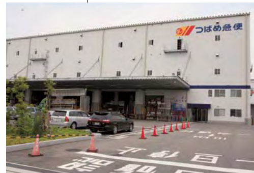
大阪ベイターミナル