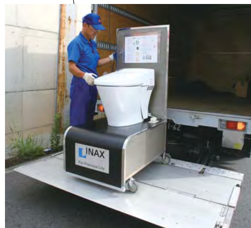
パワーゲート使用、ここで1tの荷物を下ろします