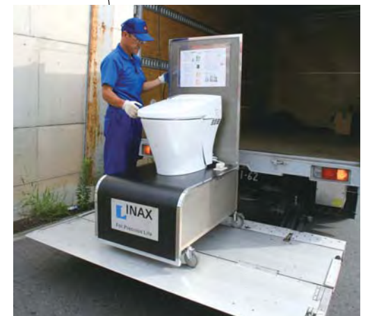
パワーゲート使用、ここで1tの荷物を下ろします