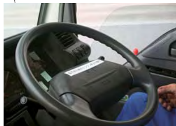
ベイターミナル角田主任が声をかける