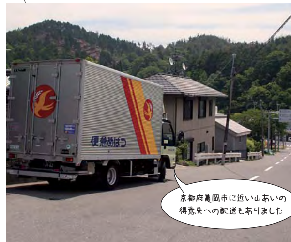
京都府亀岡市に近い山あいの得意先への配送もありました